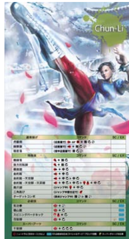
ストリートファイター X 鉄拳 キャラクターステッカー