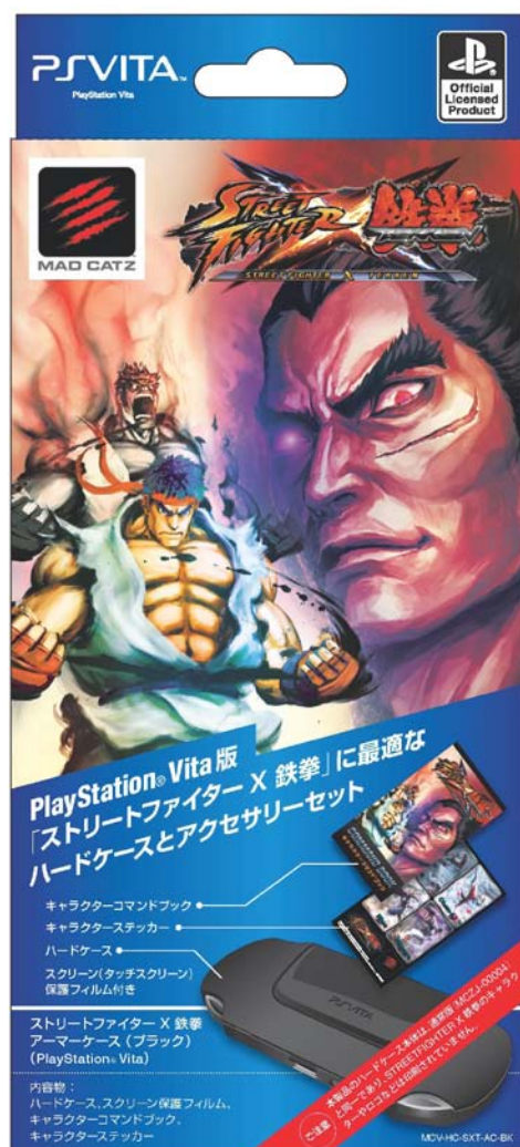
ストリートファイターX 鉄拳 アーマージェル ケース (ブラック) パッケージ イメージ