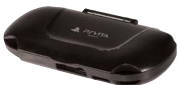
ストリートファイター X 鉄拳 アーマーケース（ブラック）