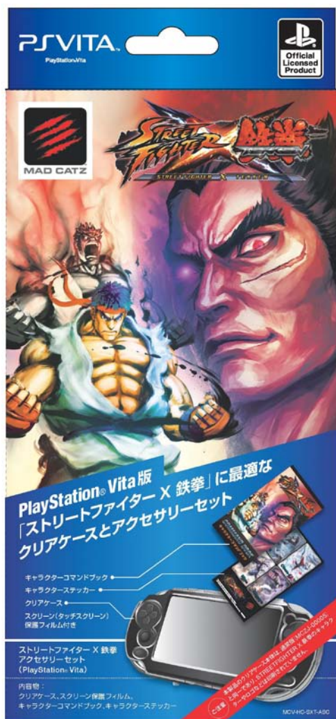
ストリートファイターX 鉄拳 アーマージェル クリアケース パッケージ イメージ