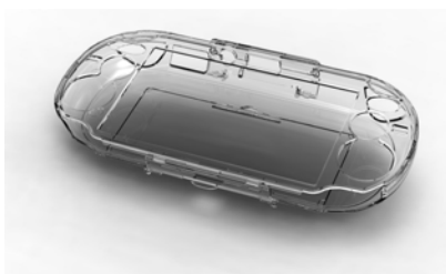
ストリートファイター X 鉄拳 アーマーシェル クリアケース