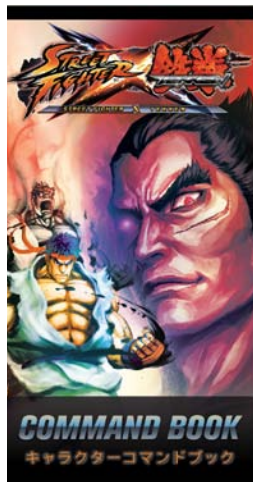
ストリートファイター X 鉄拳 キャラクターコマンドブック (60ページ/170 x 90 mm)