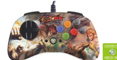
ストリートファイター X 鉄拳 ファイトパッド S.D. - サガット & ダルシム V.S. ファラン & スティープ Xbox 360 対応版 型番：MCX-FP-SXT-S