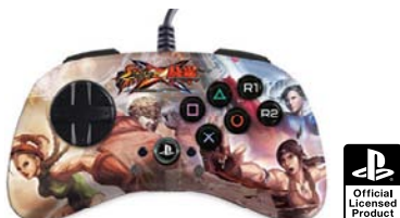
ストリートファイター X 鉄拳 ファイトパッド S.D. - 春麗 & キャミィ V.S. ジュリア & ボブ PlayStation®3対応版 型番：MC3-FP-SXT-C