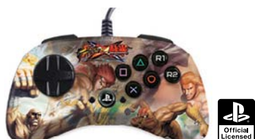
ストリートファイター X 鉄拳 ファイトパッド S.D. - サガット & ダルシム V.S. ファラン & スティープ PlayStation®3対応版 型番：MC3-FP-SXT-S