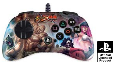
ストリートファイター X 鉄拳 ファイトパッド S.D. - ポイズン & ヒューゴ V.S. キング & マードック PlayStation®3対応版 型番：MC3-FP-SXT-P