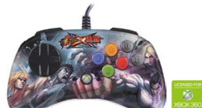
ストリートファイター X 鉄拳 ファイトパッド S.D. - リュウ & ケン V.S. ー八 & ニーナ Xbox 360 対応版 型番：MCX-FP-SXT-R