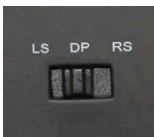
底面の機能切り替えスイッチ

また、軽量で、従来モデルと比較して15%小型化されたボディを採用することで、手の大きさに関わらず、長時間のプレイでも疲れにくい、操作しやすいデザインを実現しました。