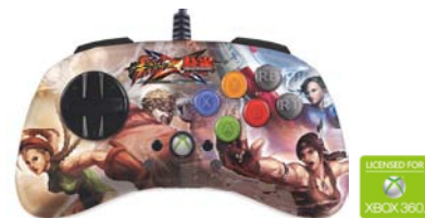
ストリートファイター X 鉄拳 ファイトパッド S.D. - 春麗 & キャミィ V.S. ジュリア & ボブ Xbox 360 対応版 型番：MCX-FP-SXT-C