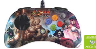
ストリートファイター X 鉄拳 ファイトパッド S.D. - ポイズン & ヒューゴ V.S. キング & マードック Xbox 360 対応版 型番：MCX-FP-SXT-P