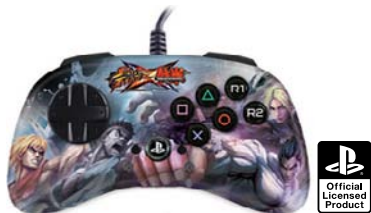
ストリートファイター X 鉄拳 ファイトパッド S.D. - リュウ & ケン V.S. ー八 & ニーナ PlayStation®3対応版 型番：MC3-FP-SXT-R