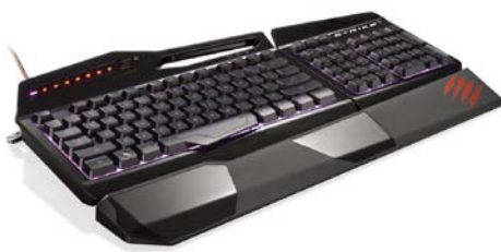
カラー: ブラック 型番: MC-STRIKE3B

ゲーム用周辺機器における世界大手メーカー米Mad Catz Interactive, Inc. の日本法人、マッドキャッツ株式会社（所在地: 東京都世田谷区、代表取締役社長: 松浦 武敏）は、「S.T.R.I.K.E.3 Gaming Keyboard」（ストライク3 ゲーミングキーボード、以下ストライク3）を希望小売価格9,980円（税込）で2013年8月9日（金）に発売します。対応OSは、Windows XP、Vista、7、8で、英語109キーレイアウトを採用しています。また、ストライク3には、3色のカラーバリエーション - ブラック（型番: MC-STRIKE3B）、ホワイト（型番: MC-STRIKE3W）、レッド（型番: MC-STRIKE3R）があります。