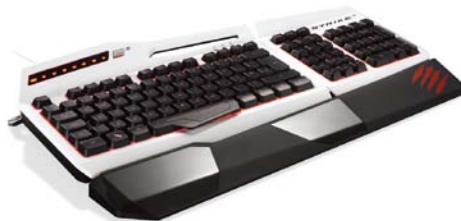
カラー: ホワイト 型番: MC-STRIKE3W