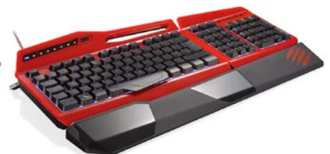
カラー: レッド 型番: MC-STRIKE3R