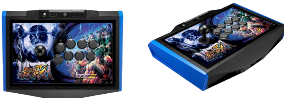
PlayStation®3 /PlayStation®4 オフィシャルライセンス製品 型番: MCS-FS-USF4-TE2

ゲーム用周辺機器における世界大手メーカー米Mad Catz Interactive, Inc. の日本人、マッドキャッツ株式会社（所在地: 東京都世田谷区、代表取締役社長: 松浦 武敏）は、同社のアーケード型コントローラー（アケコン）の「ウルトラストリートファイターIV アーケード ファイトスティック トーナメント エディション 2」（以下、TE2）が、レッドブル・ジャパン株式会社が主催する大型ゲームイベント「Red Bull 5G」の FIGHTING ジャンル「ウルトラストリートファイターIV」（株式会社カプコン）の公式デバイスとして認定されました。