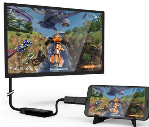
使用イメージ (テレビ、スマートフォンは付属しません)

Play Bigは、スマートフォンの小さな画面を手軽にご自宅のリビングにある大型テレビに映し出すためのケーブルセットです。大型テレビに映し出すことで、より迫力のある映像で楽しめるばかりでなく、タッチスクリーンでは指で隠れる部分もしっかり画面に映し出すことができます。