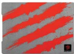
Lサイズ 30 × 22 cm G.L.I.D.E.3