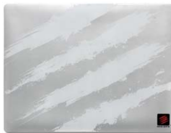
XLサイズ 約 40 × 30 cm G.L.I.D.E.7/9