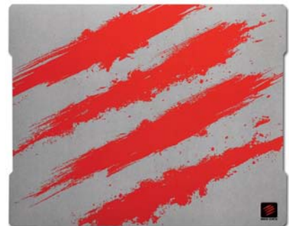
XXLサイズ 約 50 × 40 cm G.L.I.D.E.5