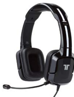
カラー：ブラック 型番：MC-KUN-SHS-BK-GAME