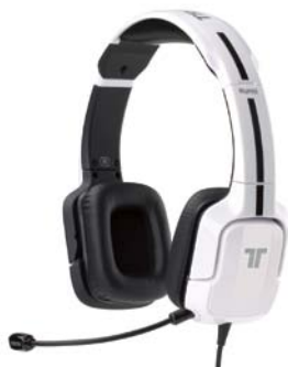
カラー：ホワイト 型番：MC-KUN-SHS-WH-GAME

TRITTONのゲームショップ向け製品としては、従来よりマルチプラットフォームの人気商品で、「TRITTON Pro+ 5.1 True Surround Headset」および「TRITTON 720+ 5.1 Surround Headset」の5.1ch以上のサラウンドヘッドセット製品がありましたが、今回は同社として初めて2chステレオのヘッドセットのマルチプラットフォーム製品の投入になります。