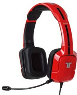
カラー：レッド 型番：MC-KUN-SHS-RD-GAME