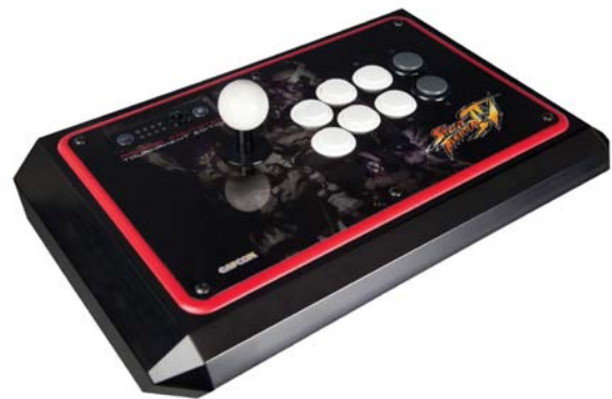
STREET FIGHTER IV Round 2 Arcade FightStick Tournament Edition for PlayStation®3

TE-R2は、発売と同時に、格闘ゲームにおける定番アケコンとなった同社TE（トーナメント エディション）のデザインバリエーションとして2009年9月に米国で発表され、ピアノブラックをベースにレッドのベゼルをアクセントとして用いたアバンギャルドなデザインと高い耐久性、信頼性から、発表後2年以上経過した現在でも、ファンの間から再発売の要望の多い製品です。